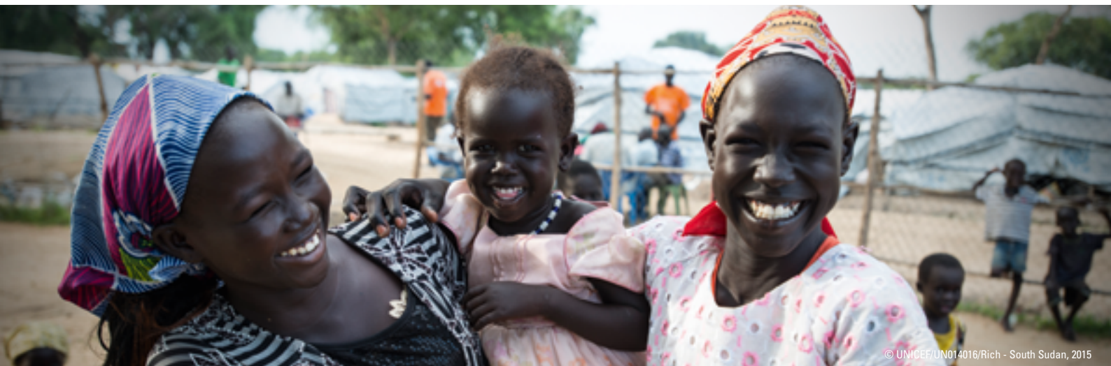
South Sudan, 2015